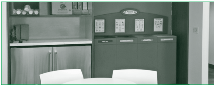
Une station de recyclage à Commerce Valley Drive

Une étude récente du Recycling Council of Ontario a annoncé un taux moyen de détournement des déchets de 66 % dans les bureaux en Ontario. Notre prochain objectif consiste à réduire la quantité totale de déchets que nous produisons en évaluant les types de matière que nous recyclons.