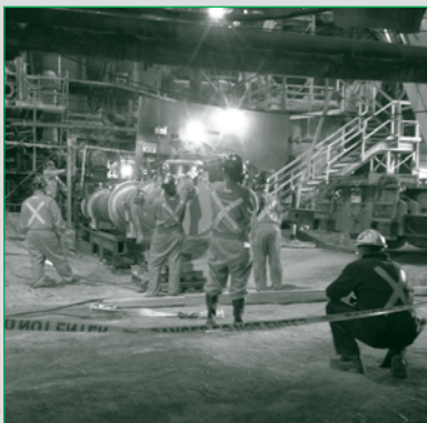
Les équipes de B&M préparent la tuyauterie d'eau de mer à la fonderie Brunswick

de protection personnelle requise pour l'exécution des travaux dans cette zone dangereuse.