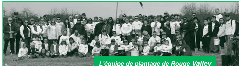
L'équipe de plantation de Rouge Valley